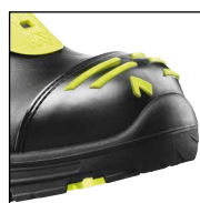
HAIX® High Durability Cap System