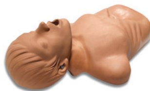
Trainer Demo-Übungspuppe Artikelnr.: 8000-0835-01