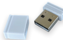
Trainer USB Softwareupgrade-Set Artikelnr.: 8028-000011-XX