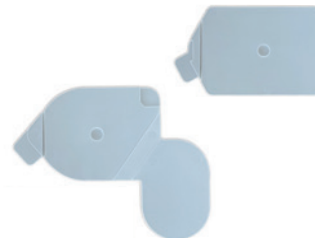
Trainer CPR Uni-padz Ersatz-Folienstreifen für Elektroden Artikelnr.: 8028-000013