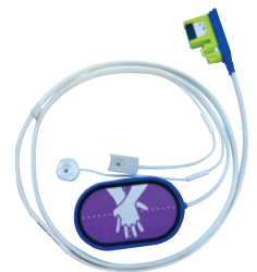
CPR Uni-padz Übungs-Elektrodenkabel Artikelnr.: 8028-000010