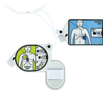
Trainer CPR Uni-padz® Ersatz-Haftgel für Elektroden Artikelnr.: 8028-000012 (5 Stück)

Ersatzteile müssen separat bestellt werden.